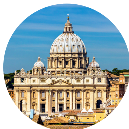
Saint-Pierre "au Vatican"