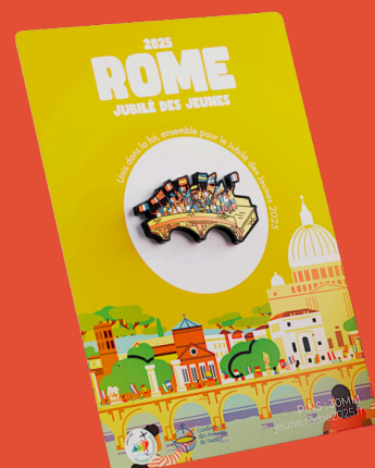
Collection de pin's à venir