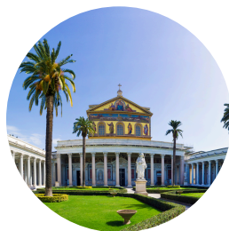
Saint-Paul Hors les murs