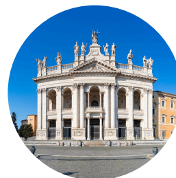
Saint-Jean de Latran