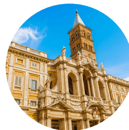
Sainte Marie Majeure