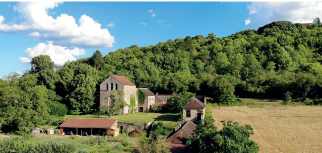
L'ermitage de la Cordelle à Vézelay (89).

En 2024, le Prix Patrimoine Religieux VMF a été décerné à l'ermitage de la Cordelle (89). Il se tient discrètement à la base de la colline éternelle de Vézelay. Son architecture simple a pour centre une chapelle romane autour de laquelle s'organise la vie de l'ermitage. Fondé en 1217 par des franciscains arrivés d'Assise, ces derniers ont réinvesti en 1949 cet ancien ermitage bénédictin abandonné en 1791. Les travaux en cours concernent la réfection des toitures, mais aussi la rénovation du portail du XVII e siècle qui marquait l'entrée du couvent et l'aménagement de l'ermitage afin de permettre l'accueil de retraitants dans un cadre de calme et de prière. Le Prix, d'un montant de 25 000 €, contribuera à la poursuite de ce projet d'accueil et de dévotion.