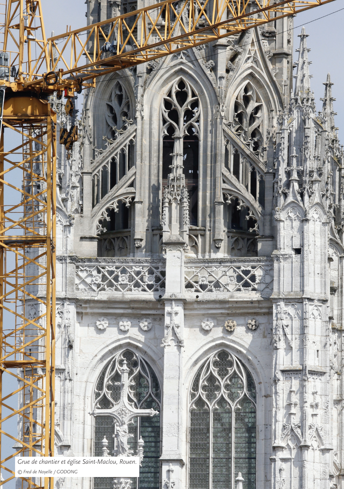
Grue de chantier et église Saint-Maclou, Rouen.