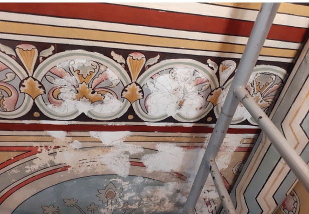
Restauration de décors peints dans l'église Notre-Dame de Gensac (Gironde).

et expositions de crèches pour réunir les ressources nécessaires. Les peintures d'une surface de 200 m 2 de la main de Léo Millet, sont aujourd'hui sauvées. L'Association de sauvegarde du patrimoine culturel et cultuel de la vallée de la Durèze a reçu, en 2023, le prix Second Œuvre attribué par l'association Sites et Monuments. La dotation financière (avec le soutien du ministère de la Culture) qui l'accompagne permettra de financer la dernière tranche de travaux programmée pour 2025.