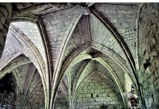
Salle capitulaire de l'Hôpital-Beaulieu d'Issendolus (46).

l'Hôpital Beaulieu et sainte Fleur, pour sauvegarder la salle capitulaire classée Monument historique en 1921. Ce soutien contribue à la consolidation et la restauration des voûtes. Des travaux de renforcement d'urgence doivent éviter tout risque d'effondrement partiel de ces voûtes. Les nervures manquantes seront restituées et les éléments de nervures éclatés seront remplacés. L'ouverture au public est prévue en 2025.