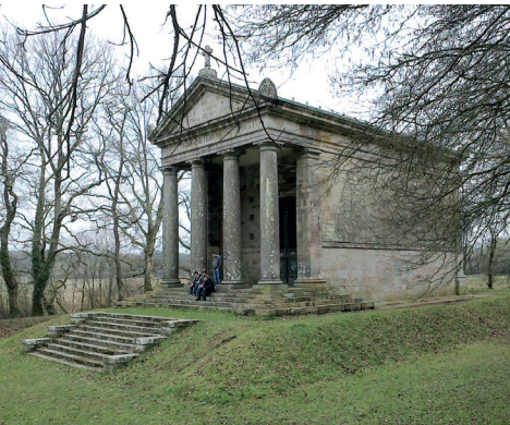
Chapelle du Champ des Martyrs de Brech (56).