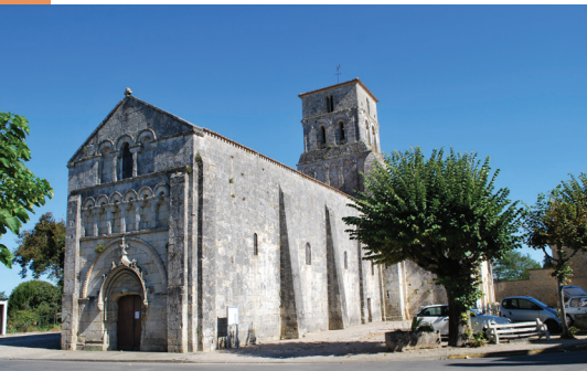
L'église Saint-Pierre de Champagnolles (17).