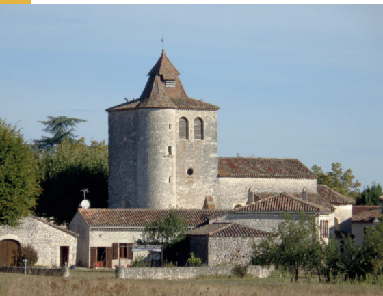
L'église Saint-André de Saux (46).