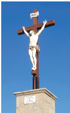
Le calvaire de Sousceyrac (46) avant et après restauration.