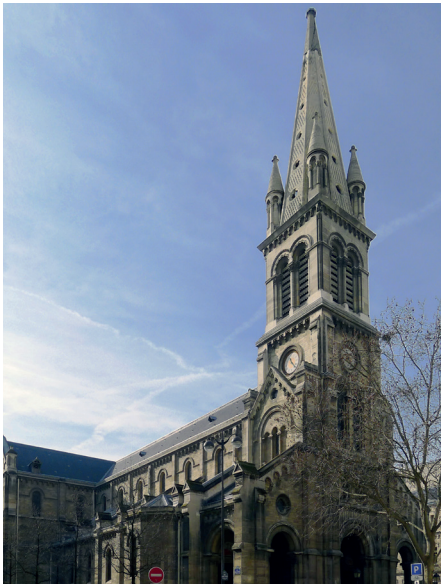
L'église Saint-Joseph des Nations (Paris 11 e ).