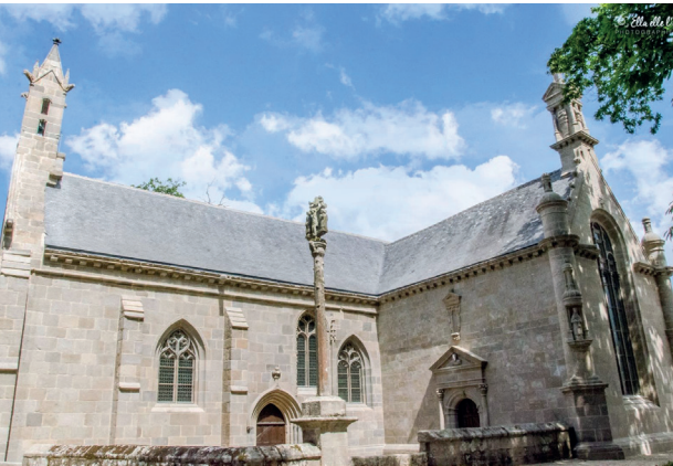
Chapelle Notre-Dame de Kerfons.