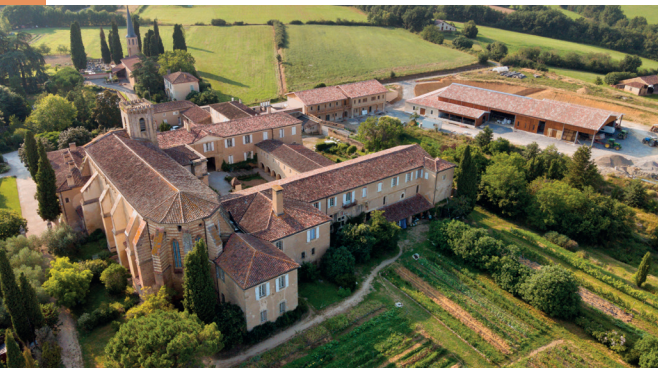
Rénovation de l'aile Est de l'Abbaye de Boulaur (32).

à adapter le site aux besoins de la communauté et enrichir son offre culturelle. Avec l'aide des Northern California et Paris chapters, ainsi que d'une donatrice privée, FHS finance la restauration de l'aile Est du XIV e siècle pour créer une bibliothèque, valorisant les collections du monastère et les recherches musicologiques cisterciennes internationales, avec un soutien de 31 000 US$.